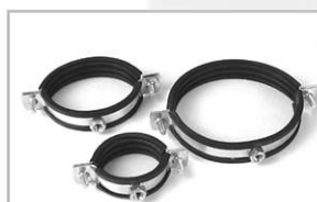
تک پایه روکش‌دار